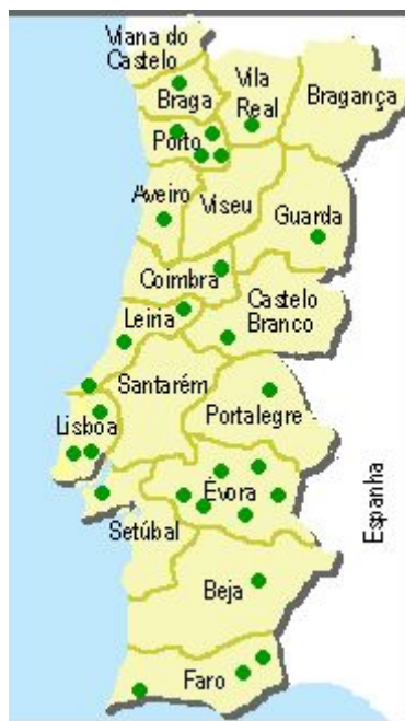
Mapa n.º 2 Distribuição nacional de SIM-PD

Indicador: evolução do número de SIM-PD criados nas Autarquias.